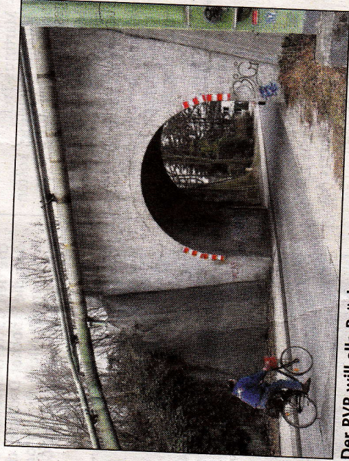
Der RVR will alle Brücken, auf denen der Radweg verlaufen wird, sanieren und neu gestalten. Hier die Brücke an der Mühlenstraße in Langenbochum.

Asphalt hingegen halte 25 bis 30 Jahre. Auf den Brücken soll